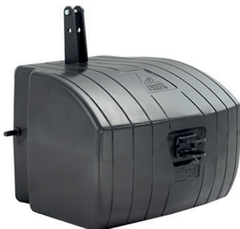
3907693M92 - 1.500 kg