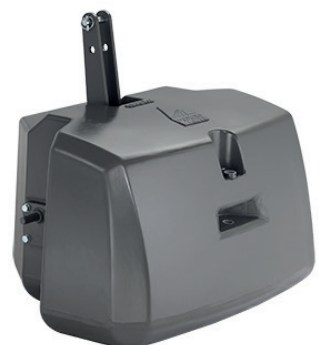
ACP0139520 - 1.800 kg