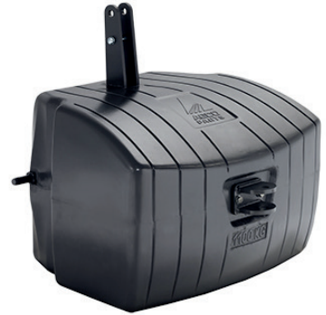
3907692M92 - 1.100 kg