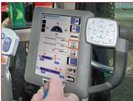
Configuration facile et intuitive du CargoProfi à l'aide du terminal Vario.