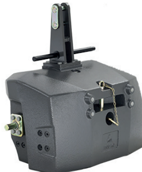
4385286M97 — 1500 kg