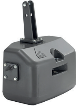
ACP0139490 — 600 kg