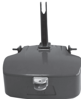
ACP0385990 — 1300 kg