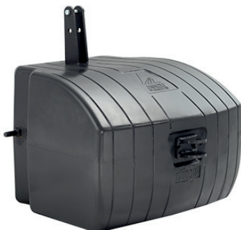
3907693M92 — 1500 kg