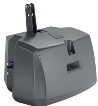
ACP0139520 — 1800 kg