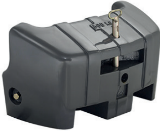
4291403M1 — 600 kg