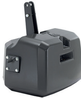
ACP0133290 — 900 kg