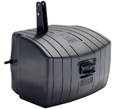
3907692M92 — 1100 kg