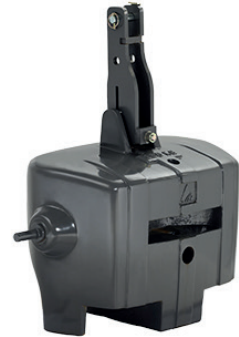
4291400M95 — 850 kg