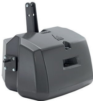
ACP0139500 — 1250 kg