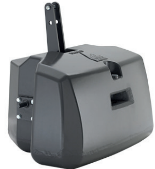
ACP0139510 — 1400 kg