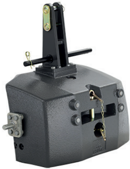
4385284M98 — 850 kg